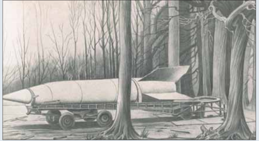
Wapens voor massavernietiging: illustratie op de introductiepagina van “Ballistics of the Future”, met een motto van Shakespeare.