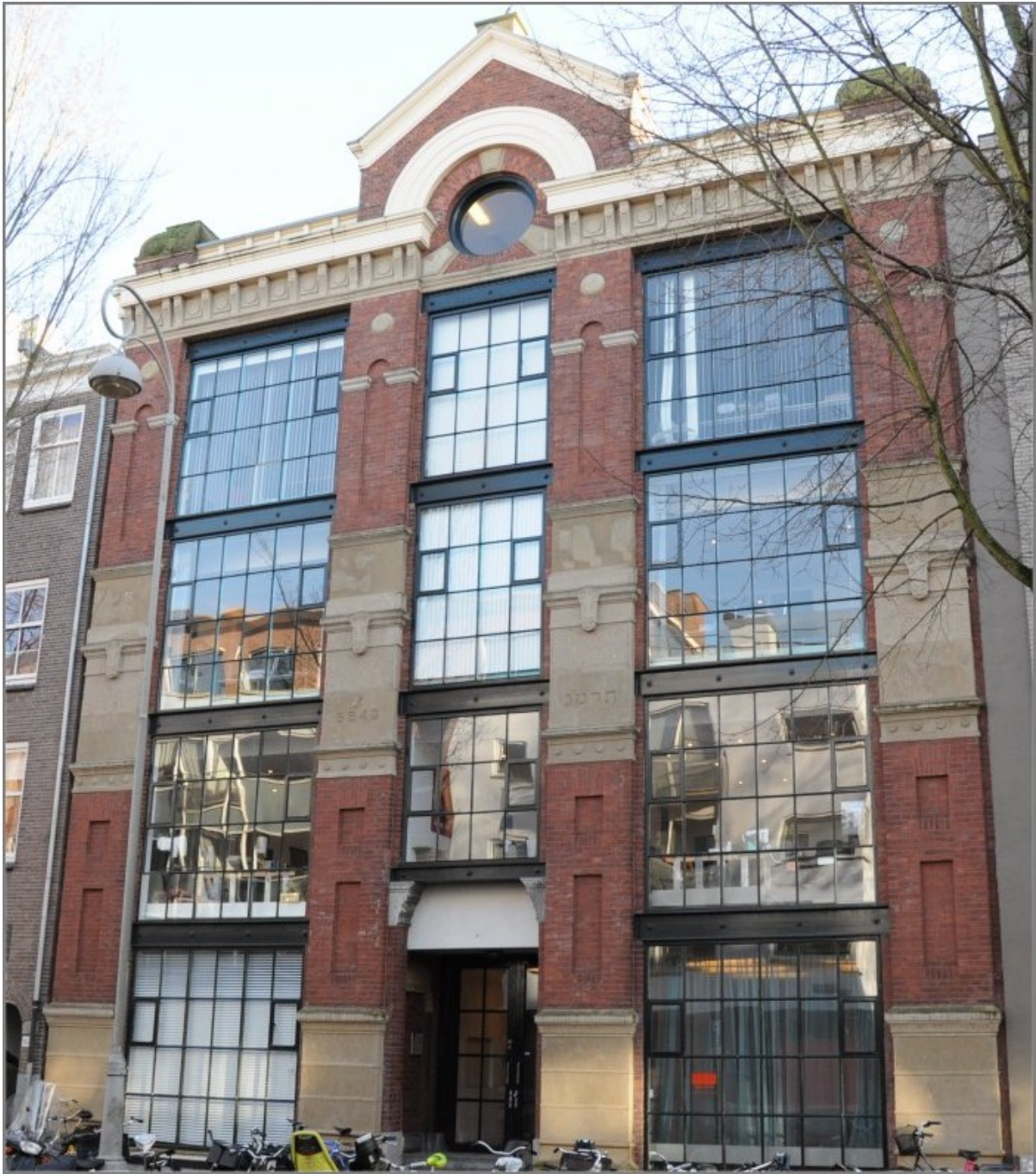
Rapenburgerstraat 169-171 Weeshuis voor meisjes