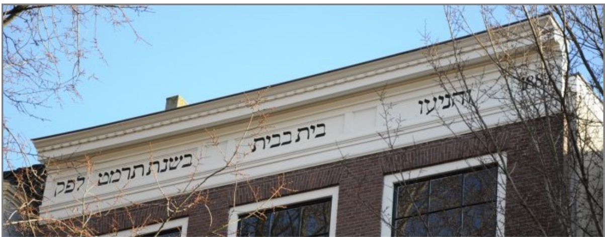
Rapenburgerstraat 173 Sjoel