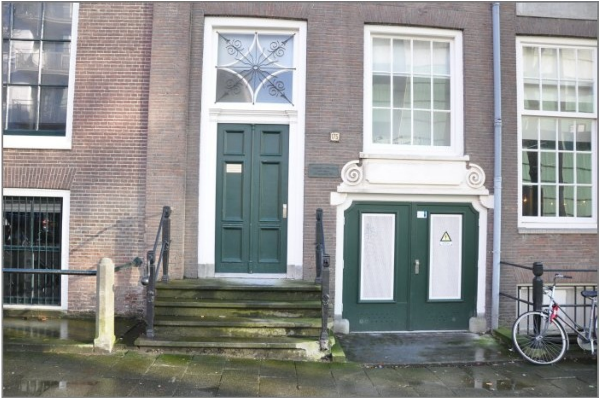
Dit is de Rapenburgerstraat gezien vanaf het Mr. Visserplein