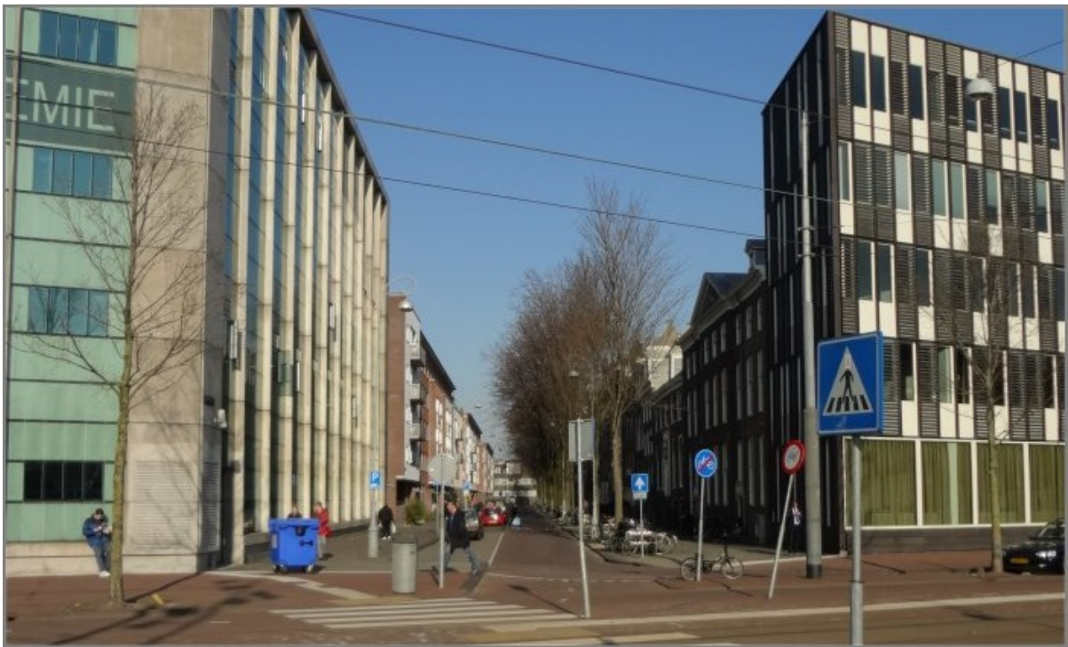
Valkenburgerstraat 202-210 Woonblok

Dit complex is opmerkelijk omdat het oud is (1877) en aantoont dat men toen al bezig was met het oplossen van grootstedelijke problemen zoals huisvesting. Houtroof, herindelingen en jarenlange leegstand deerden het pand niet want het staat er nog steeds.