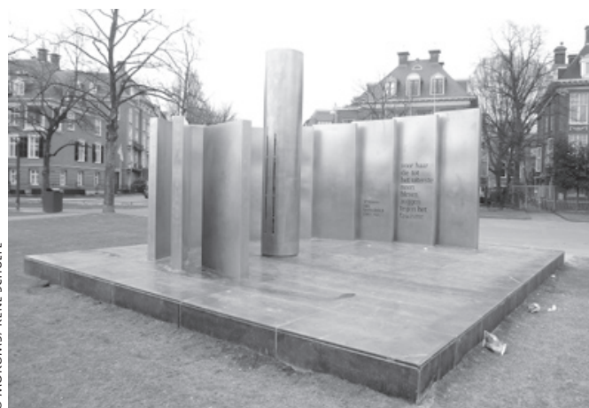
Monument voor de vrouwen in Ravensbrück (1940-1945) op het Museumplein